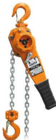
50/07 750/1500 Kg